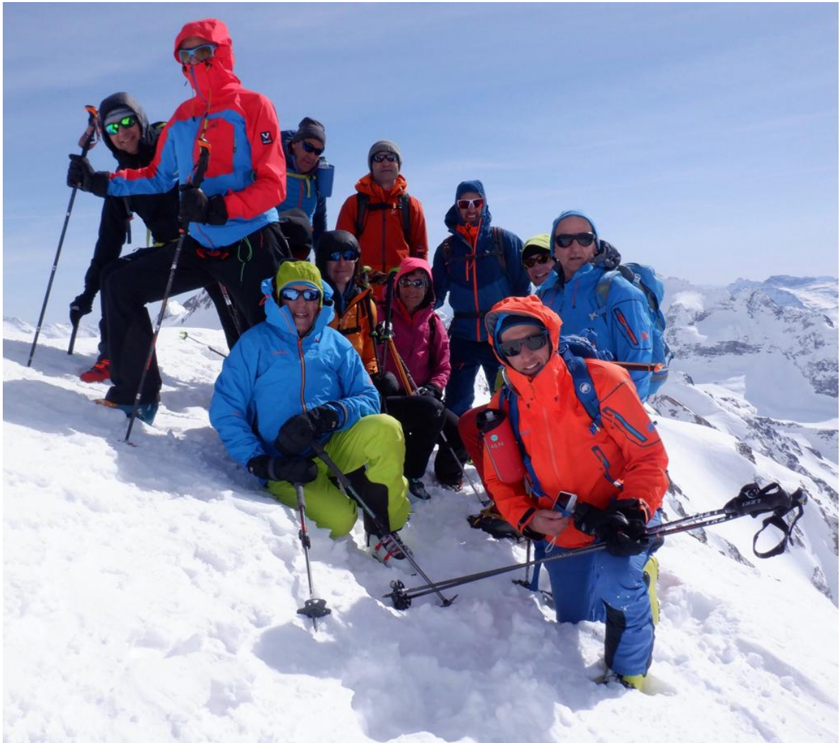
Am Ziel. Ober Rapphorn 3174 m.ü.M.

Glücklich und zufrieden aber mit sehr starkem Wind erreichten wir den Gipfel. Bestaunten das weitläufige Panorama und schlossen unser Gipfelerfolg mit einem Gipfelfoto ab.